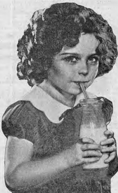
SHIRLEY TEMPLE, reina de los astros infantiles

Helados con mucha salsa... dice Shirley cuando llega a las fuentes, entendiendo por salsa las cremas de chocolate